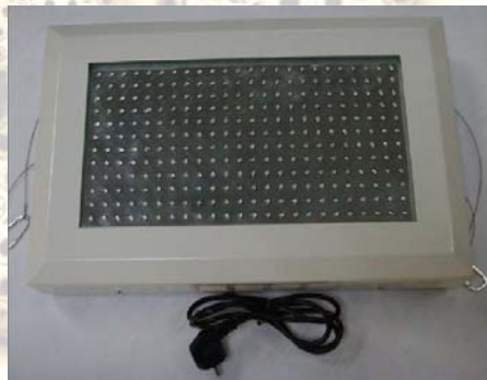
Přední strana světla